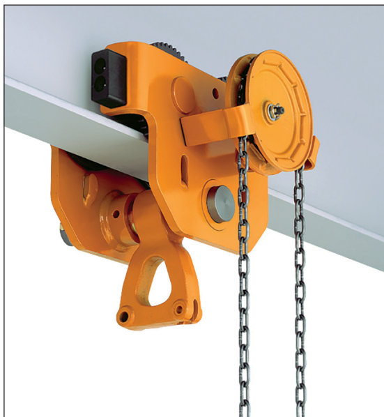
5 - 10 ton

”Velegnet til brug på kortere vandrette afstande”