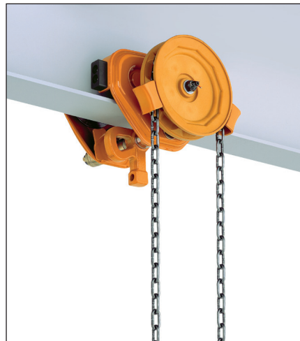
1 - 3 ton

Den håndkædefremførte løbekat fås fra bæreevne på 1 ton og op til 20 ton. Fås til forskellige flangebredde op til 305 mm.